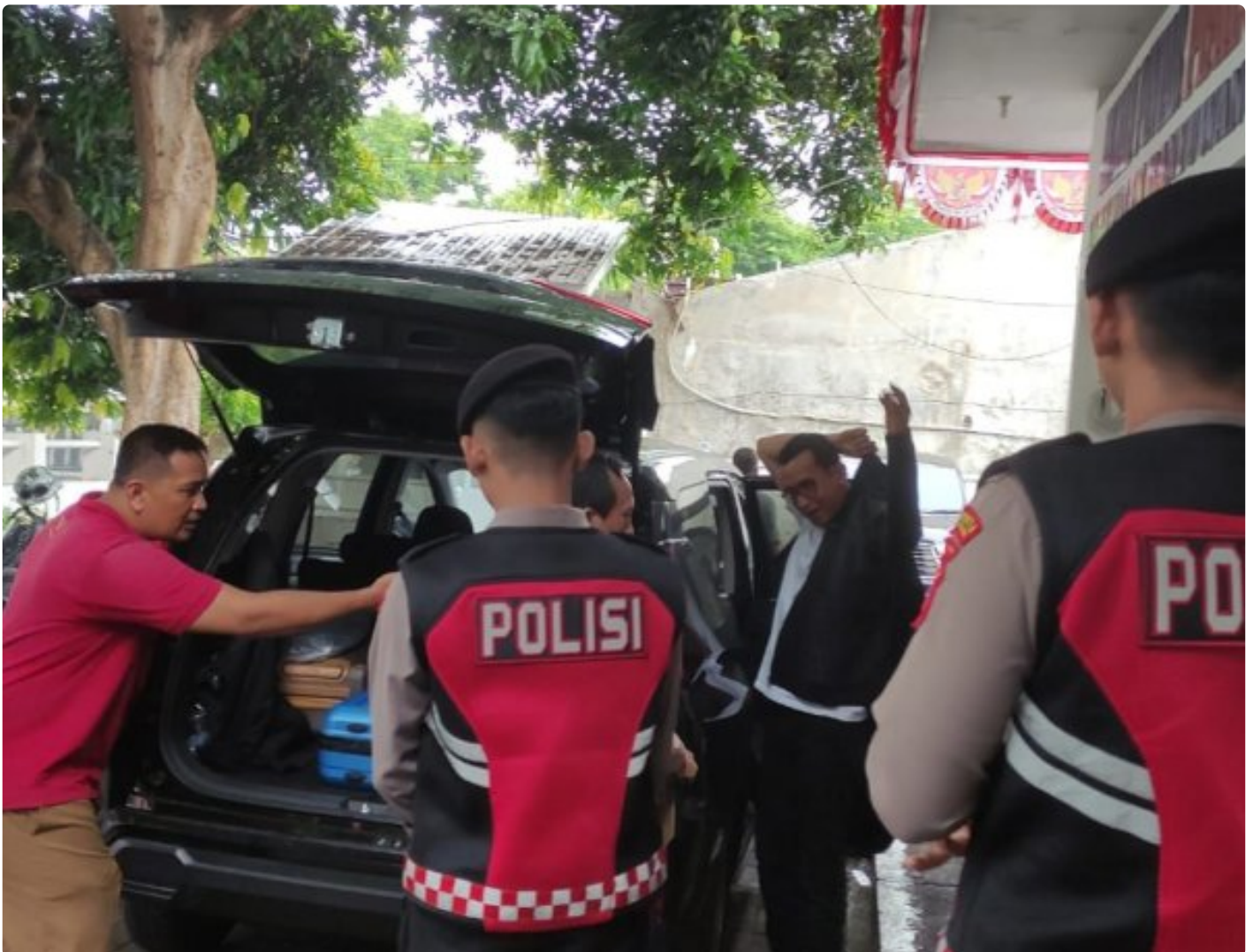
Personel Polresta Banyuwangi melakukan pengawalan ketat proses pengiriman hasil penghitungan surat suara Pilgub Jatim 2024 ke KPU Jatim

BANYUWANGI – Polresta Banyuwangi memberikan pengawalan ketat proses pengiriman hasil penghitungan surat suara Pilgub Jatim 2024 dari Kantor KPU