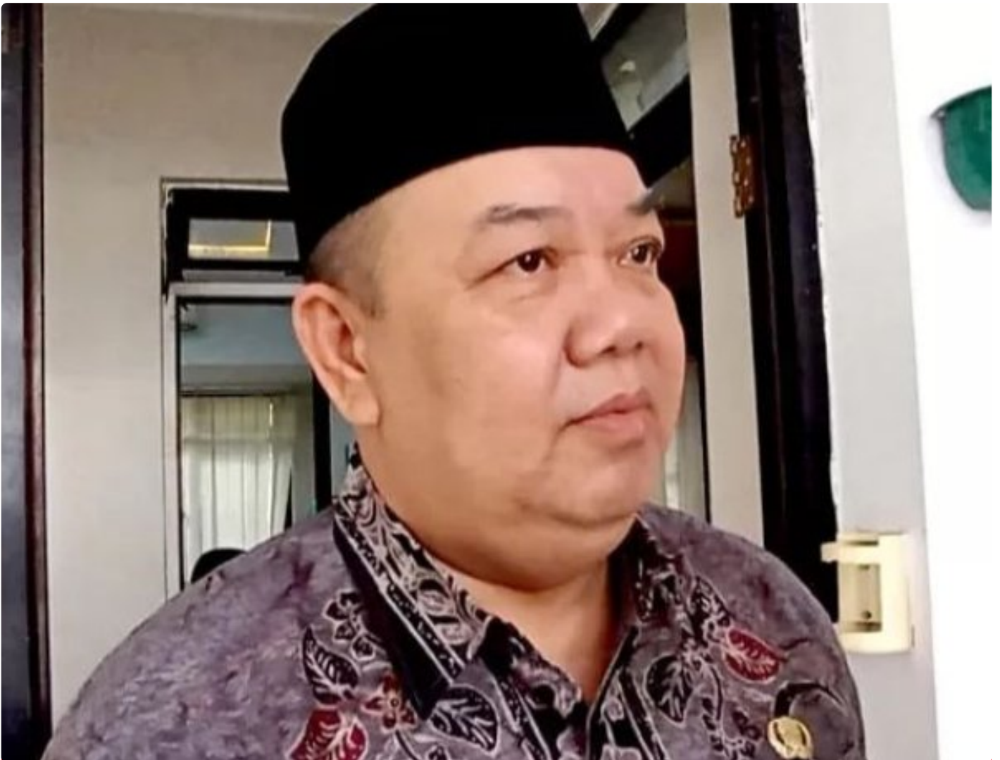
Camat Cluring Ambyah, SP

BANYUWANGI - Aksi Damai yang digelar para tokoh agama yang tergabung dalam Aliansi Umat Islam Kecamatan Cluring yang merasa resah dengan toko minuman keras (miras) yang berada di Desa Benculuk, Kecamatan Cluring, Kabupaten Banyuwangi, Jawa Timur, meminta Forpimka bertindak tegas